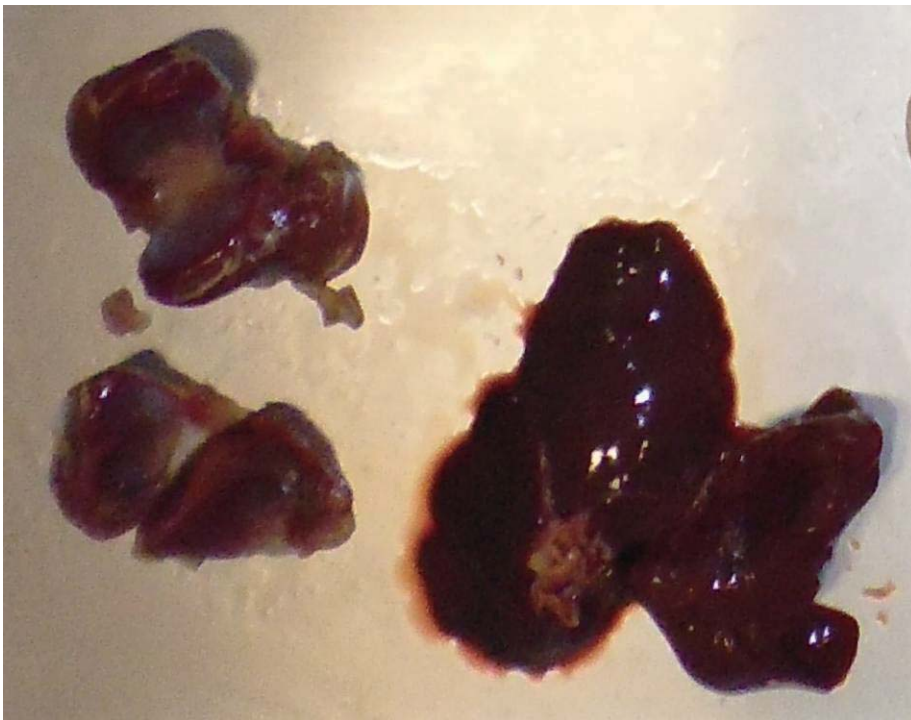
喂自来水、正常培育的鸡肉（鸡胗、鸡肝）