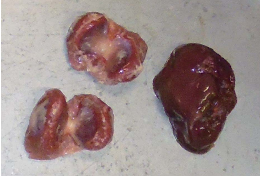
喂了 ZERO 之力量 500 倍稀释水的鸡肉（鸡胗、鸡肝）

■喂了 ZERO 之力量 500 倍稀释水的鸡肉（鸡胗、鸡肝）和喂自来水、正常培育的鸡肉（鸡胗、鸡肝）的比较试验