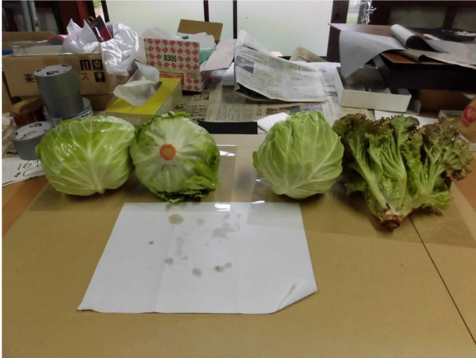
実験 キャベツ、レタス、自然、有機、超自然、有機、 2017.7.13