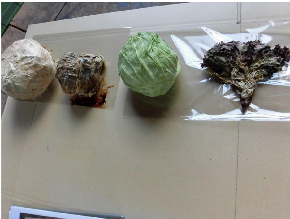
19日間実験 キャベツ、レタス、自然、有機、超自然、有機 2017.7.31