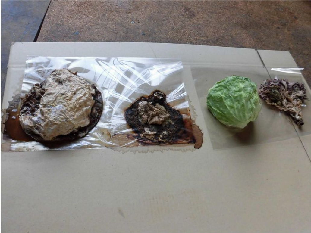
45日間実験 キャベツ、レタス、自然、有機、超自然、有機 2017.8.27